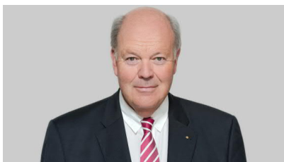
Hans-Joachim Grote (CDU) Minister für Inneres, ländliche Räume und Integration des Landes Schleswig-Holstein