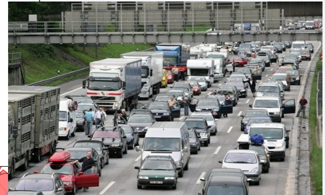
BAB 7 – Stau vor dem Elbtunnel