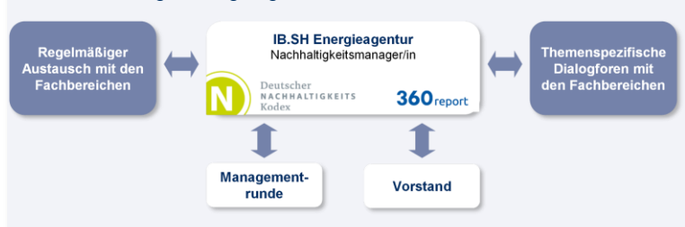
Abb.: Nachhaltigkeitsorganigramm in der IB.SH

Mit dem unternehmenskulturellen Leitsatz „Nachhaltigkeit bestimmt unser Handeln.“ ist das nachhaltige Handeln auf allen Ebenen der Bank strategisch verankert.