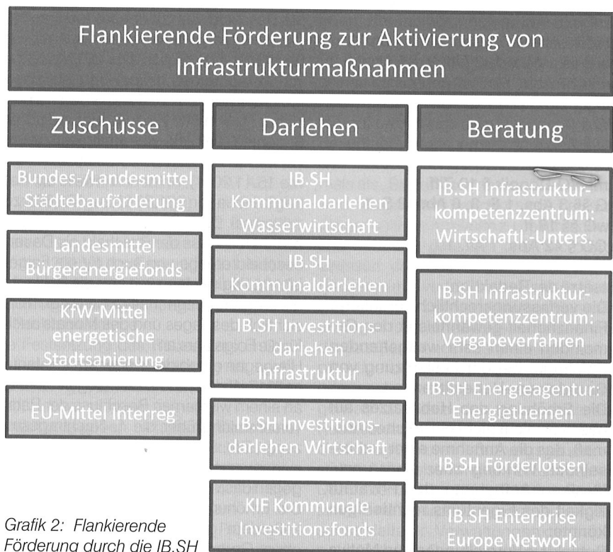
Grafik 2: Flankierende Förderung durch die IB.SH

Die schleswig-holsteinische Abwasserwirtschaft ist geprägt von einem hohen Anteil an kleinen Klärwerken (ca. 77 % oder 605 Anlagen verfügen Stand 2016 über eine Kapazität von weniger als 2.000 Einwohnerwerten). Diese Kleinanlagen werden bei erhöhten gesetzlichen Anforderungen und damit verbundenen Investitionen sowie erhöhten Betriebskosten vor großen wirtschaftlichen Herausforderungen stehen. Ob Anlagen nachgerüstet oder neu gebaut werden oder ob mehrere