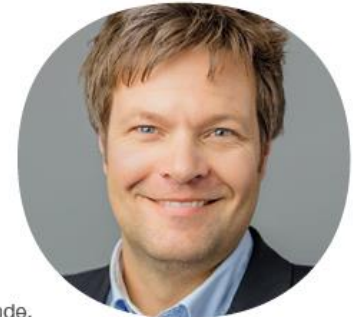
Dr. Robert Habeck, Minister für Energiewende, Landwirtschaft, Umwelt und ländliche Räume

„ Helfen Sie mit, Schleswig-Holstein effizienter zu machen. Die Energiewende braucht die Kommunen. Machen Sie mit – das können Sie auch! “